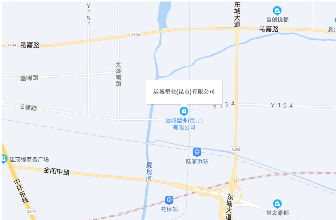
图 3.1 地理位置图