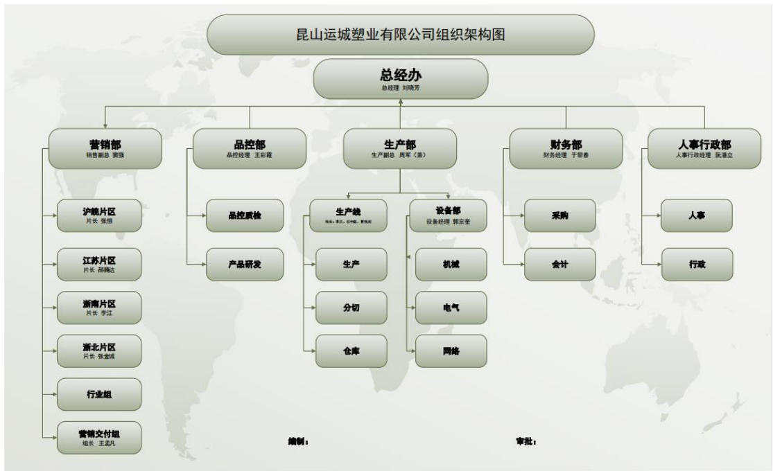
图 3.2 组织机构图